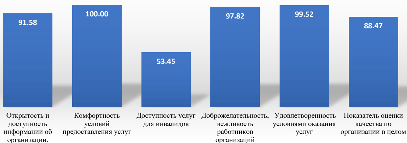
Диаграмма результатов НОКО МБДОУ "ЦРР" детский сад №85 г. Владикавказ за 2023 год

Таким образом, в ходе оценки качества образования в 2023 учебном году было установлено следующее: